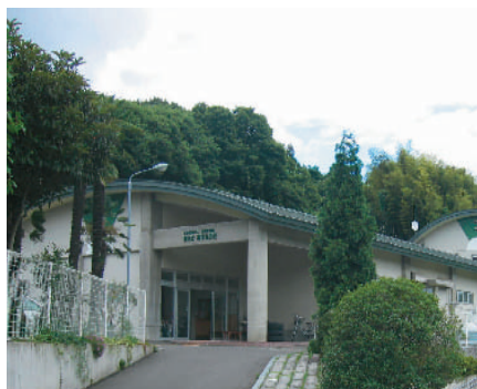
【あさかあすなろ荘】