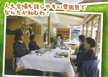
人も会場も話しやすい雰囲気です。なんだかかわいわ!

皆さんと会うのを楽しみにしていました。自分ばかりの悩みじゃないと、話していて良かったと思います。