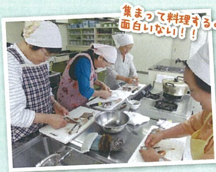
集まって料理するのも、面白いな!