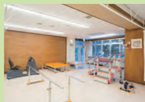
リハビリテーションスペース