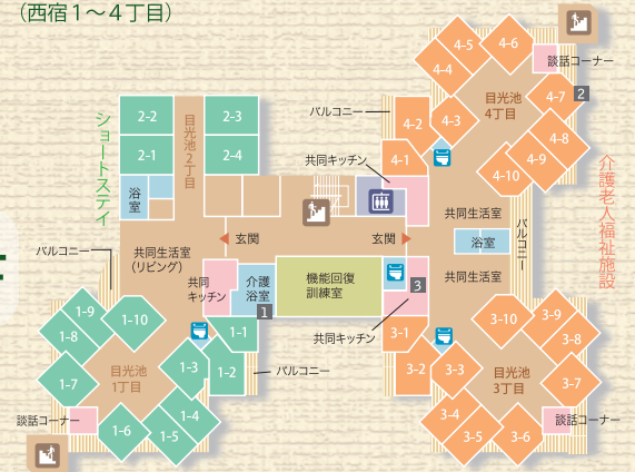
ショートステイ 14床 (日光池1・2丁目)