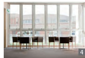
浴室 [1] 居室 [2] 共同キッチン [3] エントランス [4]