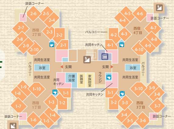
介護老人福祉施設 40床 (西宿1～4丁目)