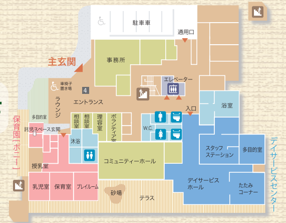
介護老人福祉施設 40床 (経坦1～4丁目)