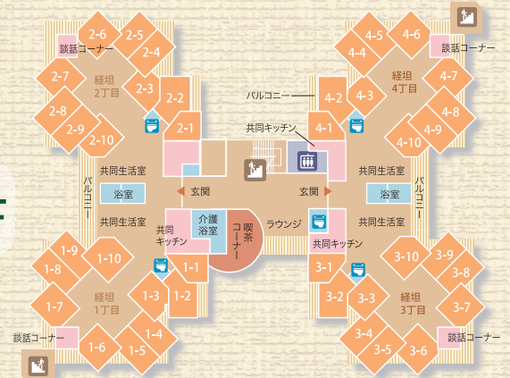
介護老人福祉施設 40床 (経坦1～4丁目)